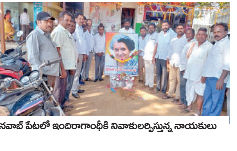
నవాపే షీటర్ ఇందిరా గాంధీకి నివాళులర్పిస్తున్న నాయకులు