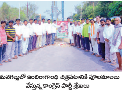
అమనగల్లులో ఇందిరా గాంధీ చిత్రపటానికి పూలమాలలు వేస్తున్న కాంగ్రెస్ పార్టీ శ్రేణులు