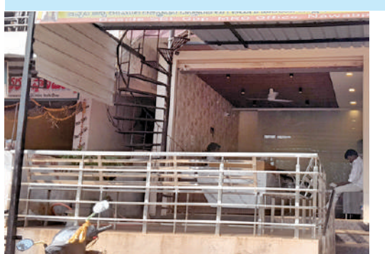
భాగ్య దర్శనమిస్తున్న డాక్యుమెంట్ రైటర్ కేంద్రం