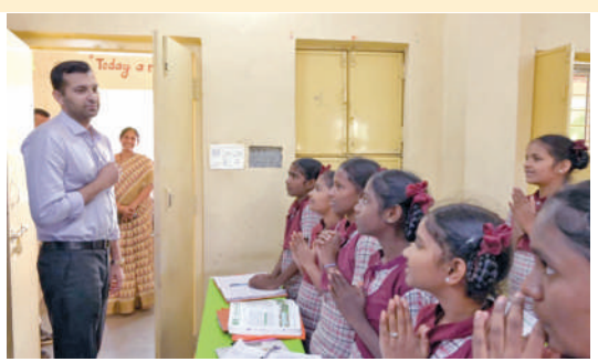
కస్తూర్ బారేకాండ్ విద్యాలయంలో మాట్లాడుతున్న జిల్లా కలెక్టర్ ప్రతీకృష్ణ

నవామిపేట నవంబరు 19 ప్రభాతవార్త: మండల కేంద్రంలోని ప్రాథమిక ఆరోగ్య కేంద్రంలో ప్రసవాలు నిర్వహించేలా చూడాలని వైద్యాధికారులకు జిల్లా కలెక్టర్ ప్రతీకృష్ణ సూచించారు. మంగళవారం ఆయన ప్రాథమిక ఆరోగ్య కేంద్రాన్ని ఆకస్మిక తనిఖీ చేశారు. భవనానికి వేస్తున్న పునరుద్ధరణ పనులను ఆయన పరిశీలించారు. డిసెంబర్ 25 వరకు పనులు పూర్తి చేయించాలని ఆదేశించారు. జిల్లాలో 25 ప్రాథమిక కేంద్రాల్లో పునరుద్ధరణ పనులు కొనసాగుతున్నాయని చెప్పారు. గర్భిణీ మహిళలను ప్రోత్సహించి ప్రసవాలు