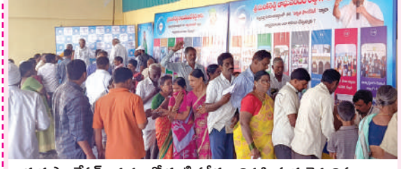
ఇక్కడ ఫౌండేషన్ ఆధ్వర్యంలో కంటి పరీక్షలు నిర్వహిస్తున్న వైద్య నిపుణులు

మెగా కంటి వైద్య శిబిరాన్ని సద్వినియోగం చేసుకోండి